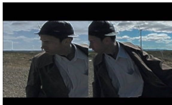
The Man with the Bag

Un homme marche à travers un paysage désertique avec sa valise. Il tombe inlassablement sur le même obstacle, une pierre, et fuit un invisible danger, ses peurs. Il traverse les frontières et se dirige toujours dans la même direction. Lentement ses bagages se métamorphosent en un sac difforme contenant les reliques d'une vie humaine.