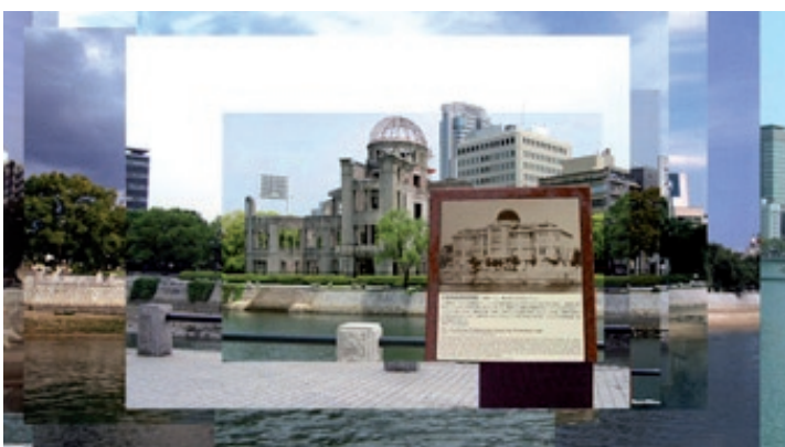
Nijuman no borei

Jeune homme cherche travail. Le premier court métrage de fiction de Jean-Gabriel Périot traite de l'un de ses thèmes de prédilection, le travail, qui pourtant est une des choses qu'il avoue « comprendre le moins ».