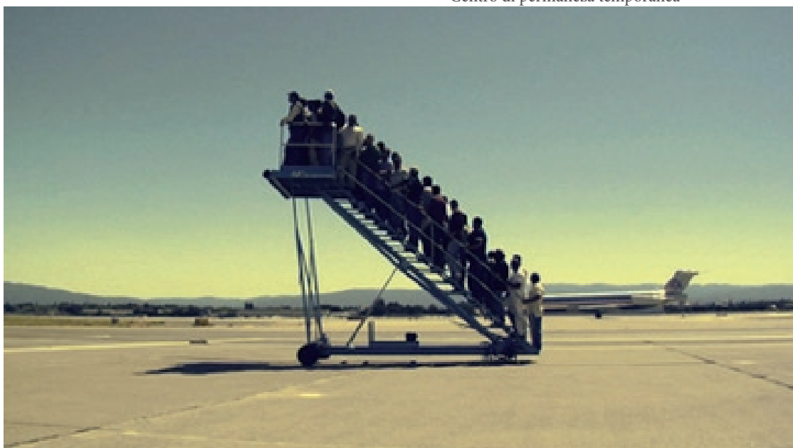
Centro di permanenza temporanea

L'action se déroule sur la piste d'un aéroport. Une longue file de voyageurs se dirige vers les escaliers pour monter à bord d'un avion. Mais aucun avion n'est là pour les faire s'envoler. Là où ils se trouvent – entassés, suspendus en l'air, immobiles et silencieux – la seule chose qui leur reste est de regarder les avions grouillés autour d'eux.